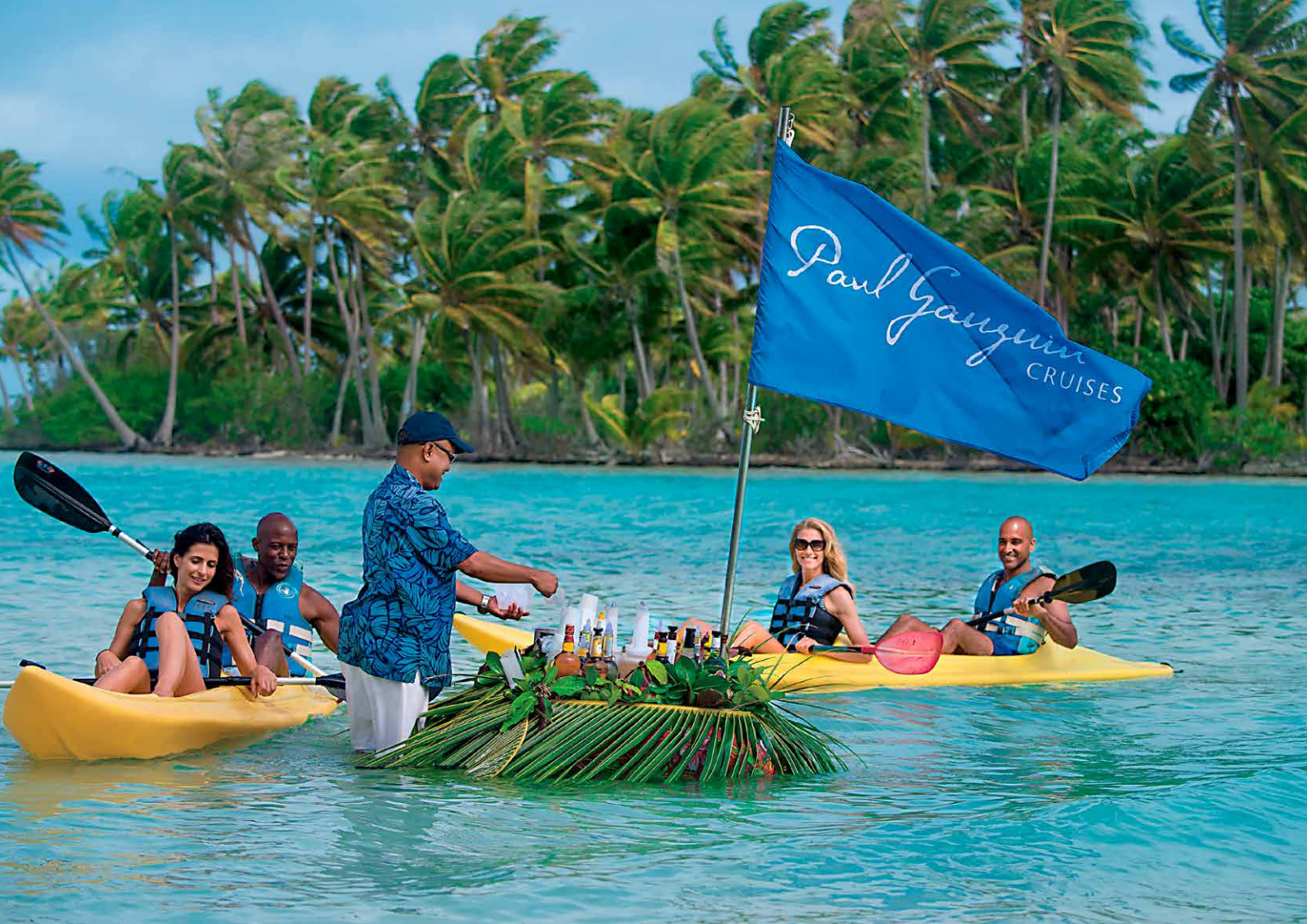
プライベートアイランド モトゥ・マハナ (タハア島)