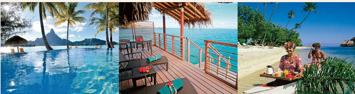
インターコンチネンタル・ボラボラ・リゾート&タラソ・スパ

ボラボラ島の美しい朝をより堪能できる、島で最も豪華なホテルのひとつ「インターコンチネンタル・ボラボラ・リゾート&タラソ・スパ」への宿泊プラン。カヌーで運ばれてくる朝食などドラマティックな演出は旅の思い出をより深くします。