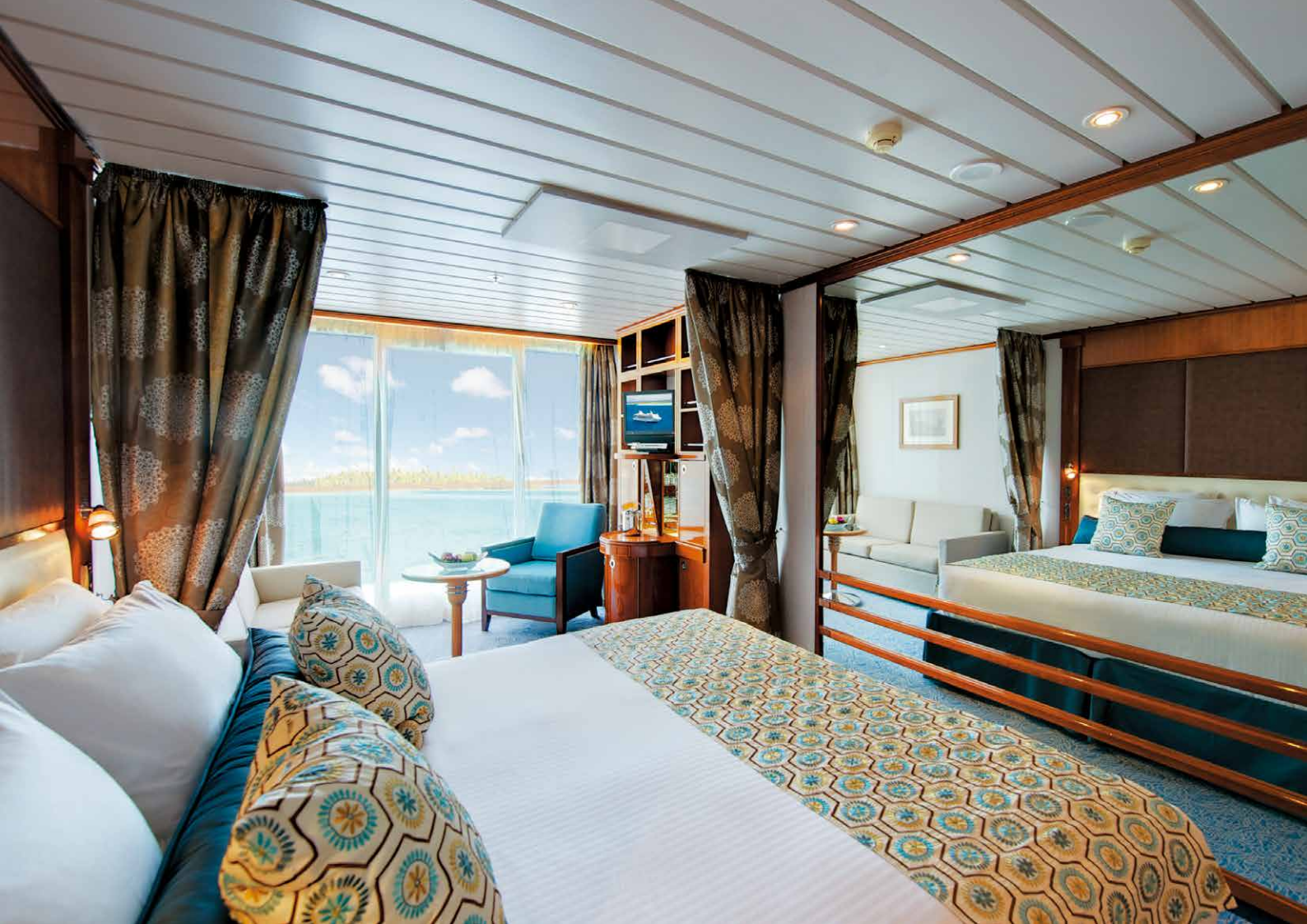
客室は全室オーシャンビュー、7割がバルコニー付き