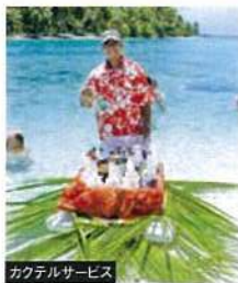
カクテルサービス

タヒチ旅行の玄関口・首都パペーテがあるタヒチ島、水上コテージなどハネムーナーの人気のとくに高いボラボラ島、歴史と自然を色濃く残すタハア島など、それぞれ雰囲気異なります。島ごとの特徴を見つけながらご自身のペースでお過ごしください。