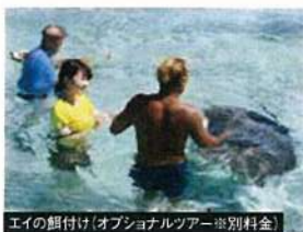
エイの餌付け(オプションツアー※別料金)

ウクレレの音色、タヒチアンの歌を聴きながらゆったりと島で過ごす時間は、南国ならではの体験です。カクテルサービスもご用意がございます。