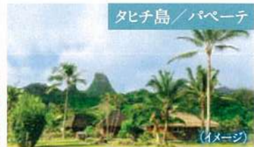
タヒチ島 / パペーテ