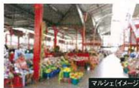
マルシェ(イメージ)

タヒチ旅行の玄関口・首都パペーテがあるタヒチ島、水上コテージなどハネムーナーの人気のとくに高いボラボラ島、歴史と自然を色濃く残すタハア島など、それぞれ雰囲気異なります。島ごとの特徴を見つけながらご自身のペースでお過ごしください。