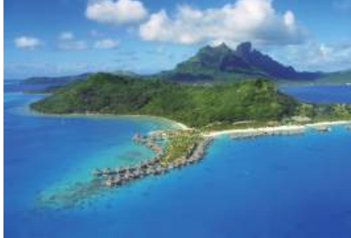
ボラボラ島(フランス領ポリネシア)

「太平洋の真珠」と称される、パレットのようなラグーンに囲まれたボラボラ島。白い砂浜の先には、カラフルな熱帯魚や巨大なマンタが優雅に泳ぐ青い海が広がります。