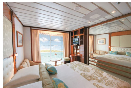
～客室一例～ C/D バルコニー・ステートルーム 22.2㎡(プライベートバルコニー付)