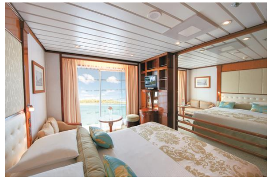
～客室一例～ C/D バルコニー・ステートルーム 22.2㎡(プライベートバルコニー付)