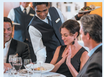
ディナーはパリの有名シェフ監修の本格フレンチを

クルーズ出航日の前日から起算して91日前まではキャンセルチャージはかかりませんので、早めのお申し込みをお勧めいたします。