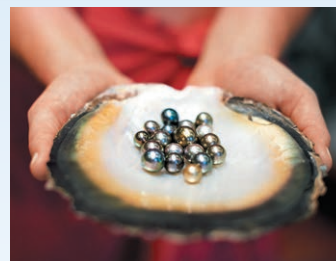
バニラ農園と黒真珠養殖場を訪問 (オプションツアー)