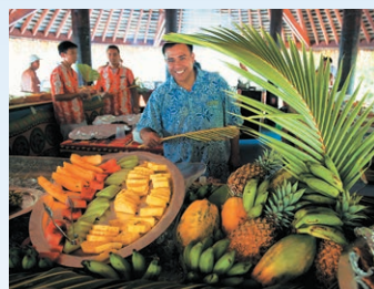
プライベートアイランドでトロピカル・フルーツやランチBBQを満喫