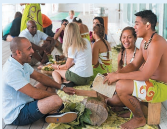
レ・ゴギンズと一緒に船上でタヒチ文化を体験