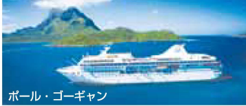
ポール・ゴーギャン