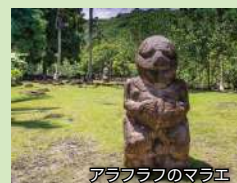
アラフラフのマラエ

※英語ガイドのご案内となります。 ※乗船後、ショアエクサカーションカウンターでお申込みください。