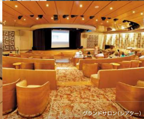
グランドサロン(シアター)