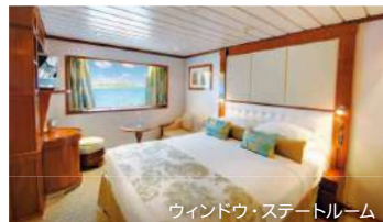
ウィンドウ・ステートルーム