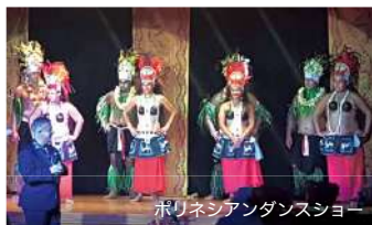
ポリネシアンダンスショー

船内は寄港する島々の美しさや文化、そしてタヒチの人々のフレンドリーな雰囲気反映されており、ポリネシア人エンターテイメントクルーのレ・ゴギンズが伝統の歌や踊り、そして様々な講座を通してタヒチの伝統文化を伝えてくれます。ラグジュアリーでありながらもリラックスできる最高の休日をお約束します。