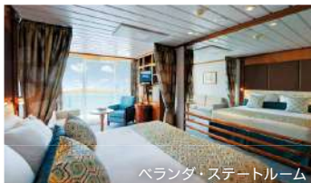
ベランダ・ステートルーム