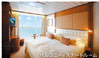
バルコニー・ステートルーム